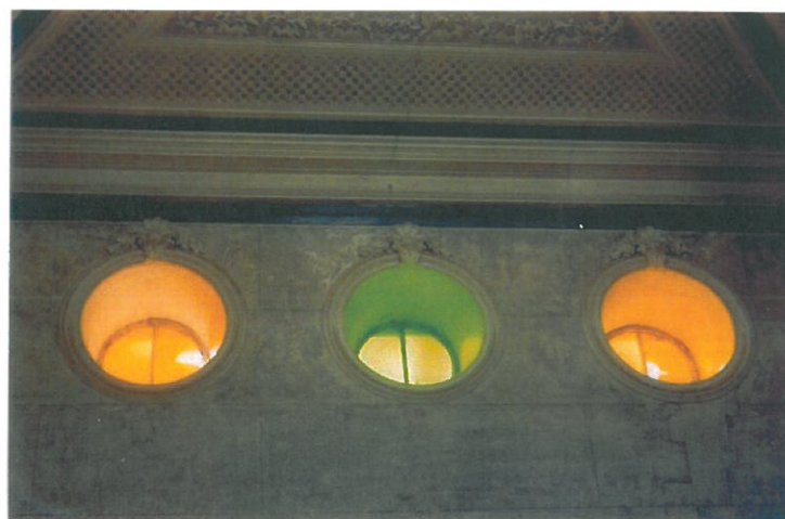
Óculos de iluminação com vidraça colorida do Edifício da Administração