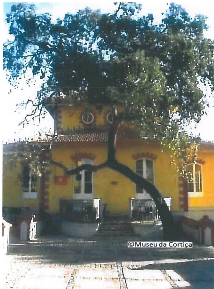
Edifício da Administração da Fábrica do Inglês. 1997. Coleção do Museu da Cortiça.