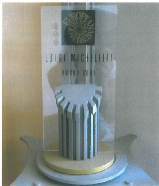
Prémio Internacional Coleção do Museu da Cortiça