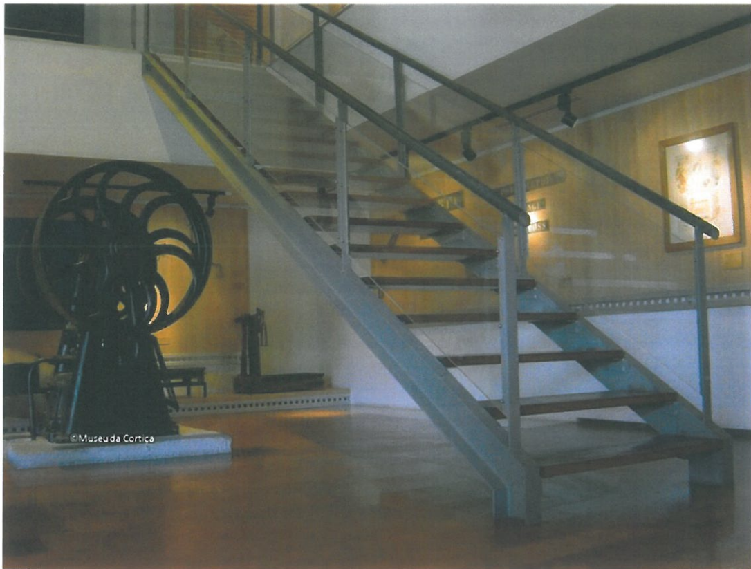
Acesso à Casa da Prensa, a partir do nível superior, onde se encontra o núcleo do Universo Produtivo. Coleção do Museu da Cortiça.