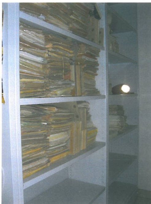
Aspecto do antigo Centro de Documentação / Arquivo da Museu. Coleção do Museu da Cortiça. O Arquivo encontra-se actualmente depositado no Arquivo Distrital de Faro.