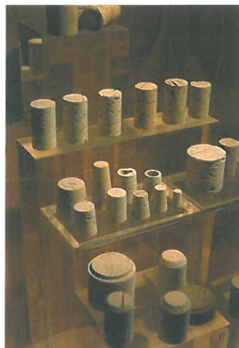
Universo Produtivo. Vitrina do Produto. Aspecto Parcial: rolhas. Coleção particular