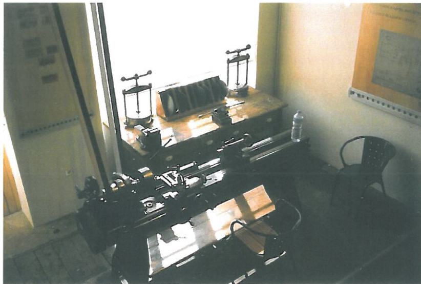
Oficina de Serralharia. Torno Mecânico.