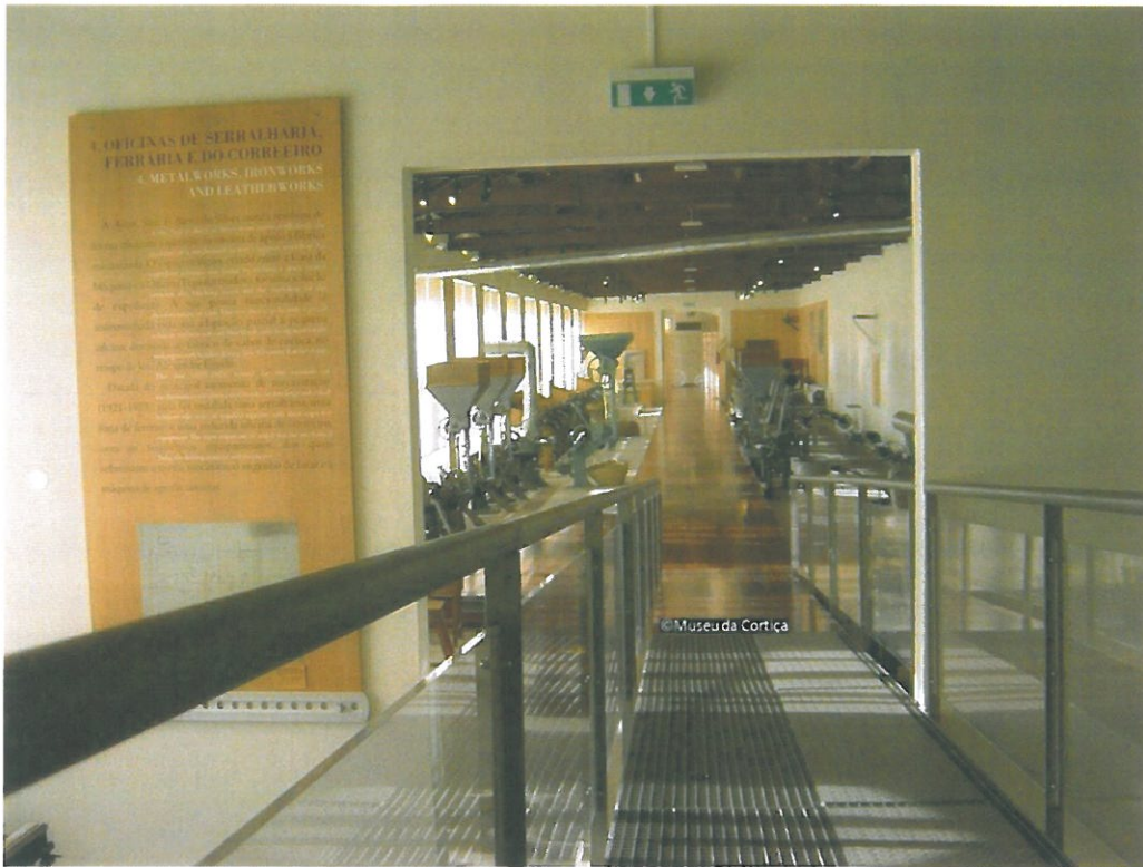
Interface entre a Oficina Transformadora e as Oficinas de Serralharia, Ferraria e do Correiro, a partir do acesso à mezanina. Coleção do Museu da Cortiça.