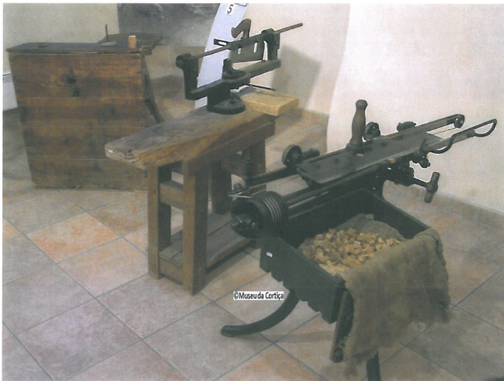
Posto de trabalho do operário rolheiro manufactureiro com máquina de garlopa. Coleção do Museu da Cortiça