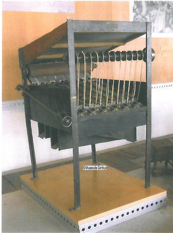
Oficina Transformadora. Máquina Contadora de Rolhas encomendada à Sireno Prats, Lisboa. Coleção do Museu da Cortiça. Esta máquina é uma das mais raras das coleções dos museus de cortiça a nível internacional