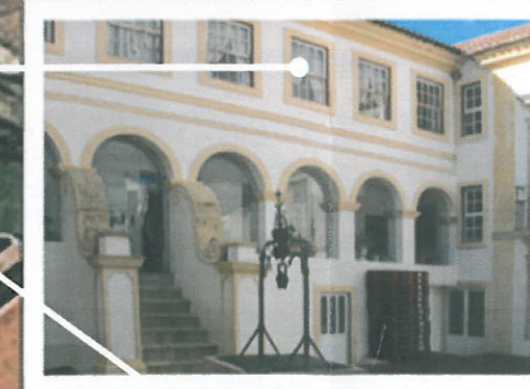
Fachada SO do claustro (Lar da Santa Casa da Misericórdia)