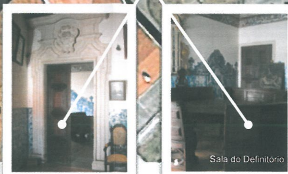
Sala do Definitório