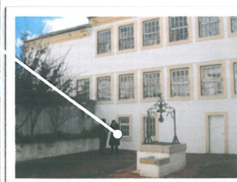
Poço (cisterna) e fachada SE do claustro (Lar da Santa Casa da Misericórdia)