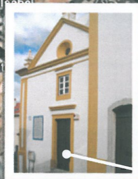
Fachada do templo