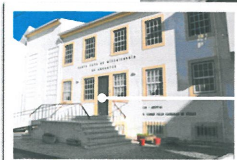
Lar da Santa Casa da Misericórdia (reconversão do antigo Hospital)