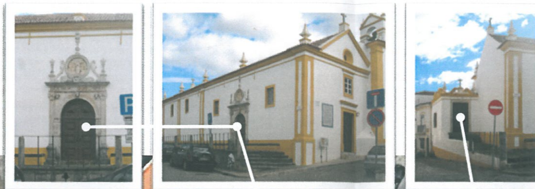
Cabeceira do templo e acesso ao pátio traseiro