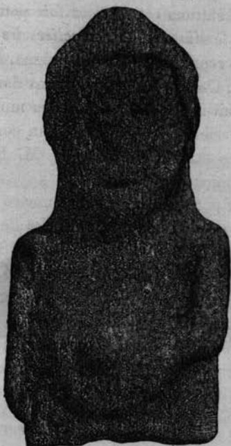
Fig. 1. 2 — Fragmento da estatua do guerreiro Lusitano

Examinemo-la de perto. O capacete é, como disse, conico; o vertice acha-se um tanto esmurrado, o que torna o capacete um pouco mais baixo do que era primitivamente. Como na posição em que foi tirada a photographia não era possível ver o capacete por completo, dou aqui (fig. 2) o desenho especial d'elle, tirado de frente, em toda a extensão 1 . A face não tem expressão; os olhos são dois buracos informes; das arcadas orbitarias só a direita sobresaie um pouco; o nariz está tambem esmurrado; a bôca torta; toda a fronte oblonga e achatada. As orelhas são muito apparentes, mas toscas: a direita está es-